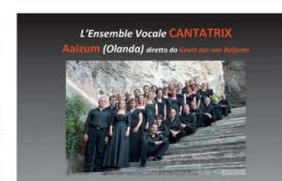
Cantatrix: una storia di successo in musica