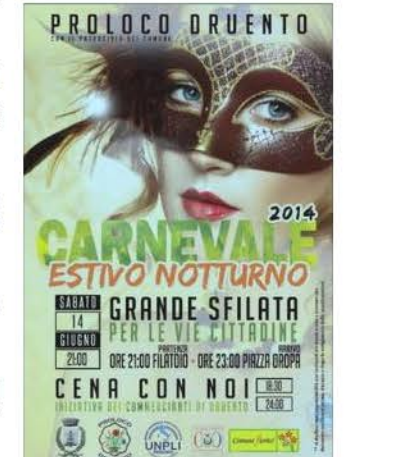
Carnevale Estivo Notturmo