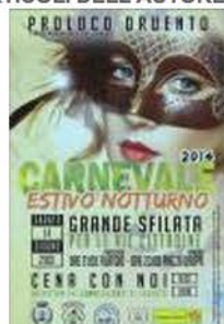
Carnevale Estivo Notturmo