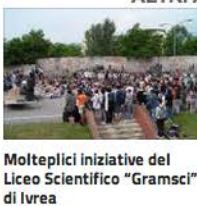
Molteplici iniziative del Liceo Scientifico "Gramsci" di Ivrea