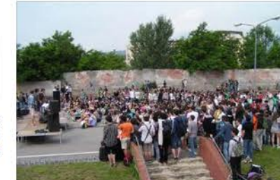
Molteplici iniziative del Liceo Scientifico "Gramsci" di Ivrea