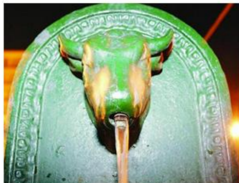
Il Toret dagli anni 30 è uno dei simboli della città. + Toret abbandonati, "Bisogna adottarli" BEPPE MINELLO

«I "Toret" di Torino, le tipiche fontanelle della città con testa di toro, devono rimanere verdi, così come si sono storicizzate. Non si chiede agli artisti il compito di intervenire con la loro creatività per tutelarle dalle deturpazioni. La manutenzione è compito dell'acquedotto. La vigilanza sulla loro incolumità spetta ai vigili».